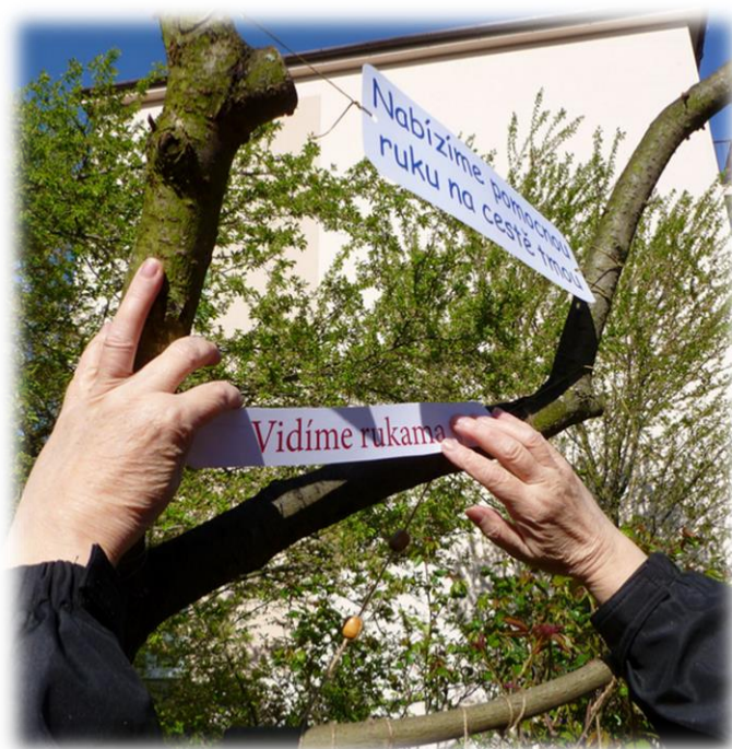
„Vidíme rukama“, akce „Lanaříme do TyfloCentra“ (20. 4. 2016).